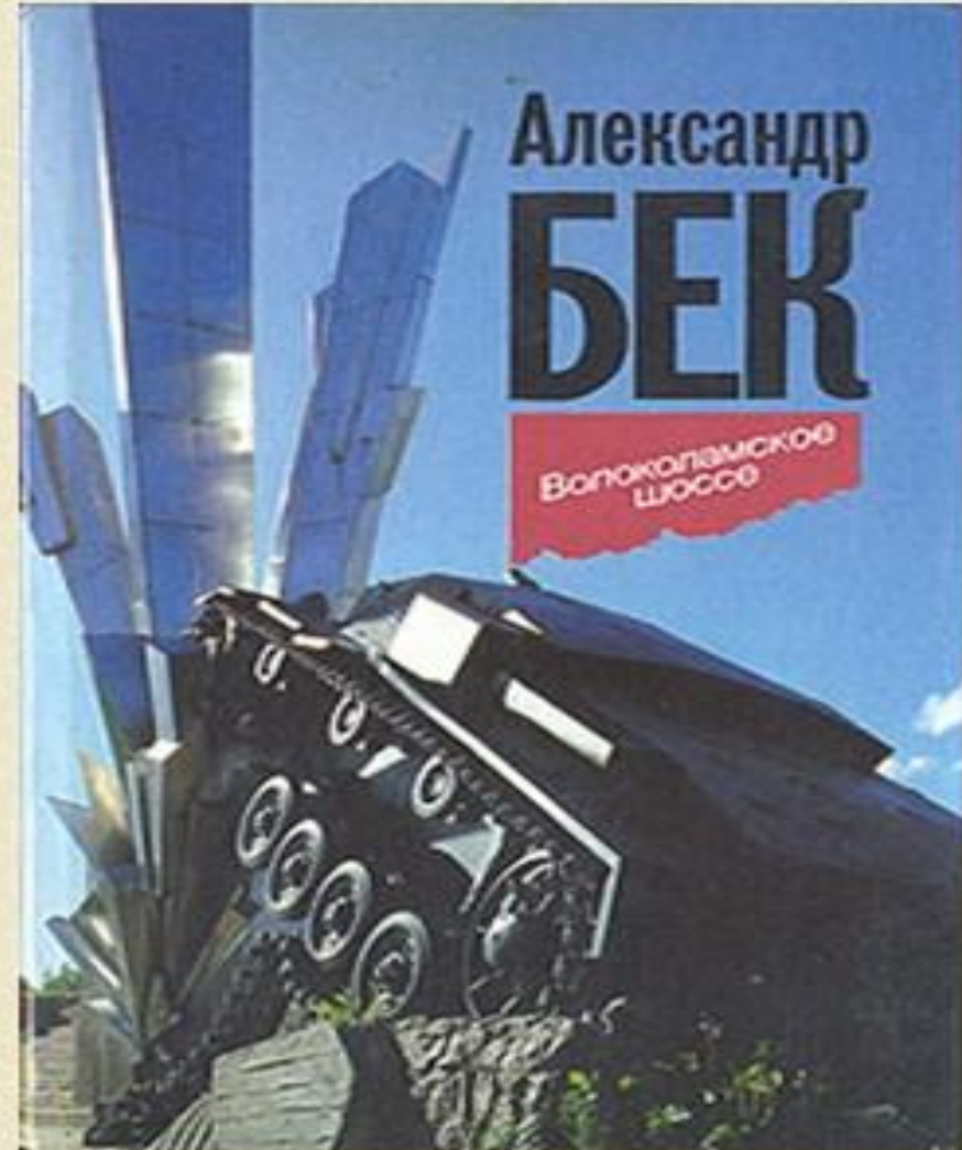
Александр Бек Повесть – «Волоколамское шоссе»